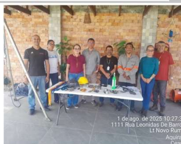
NR33 (Espaço Confinado)