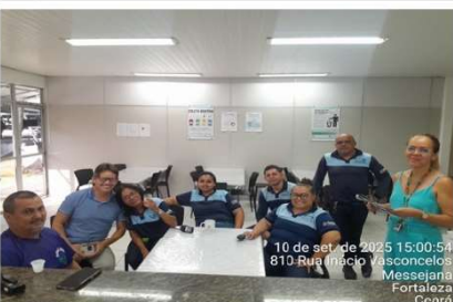
Manuseio Seguro de Produtos Químicos