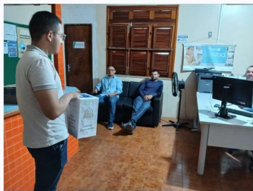
Janeiro Branco - Regionais