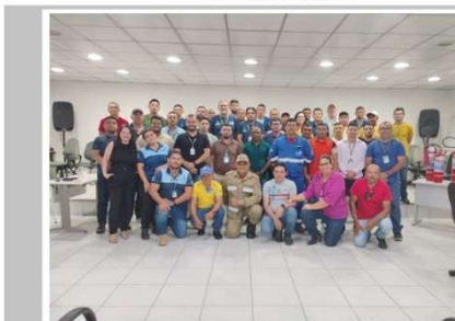
Recertificação da Brigada