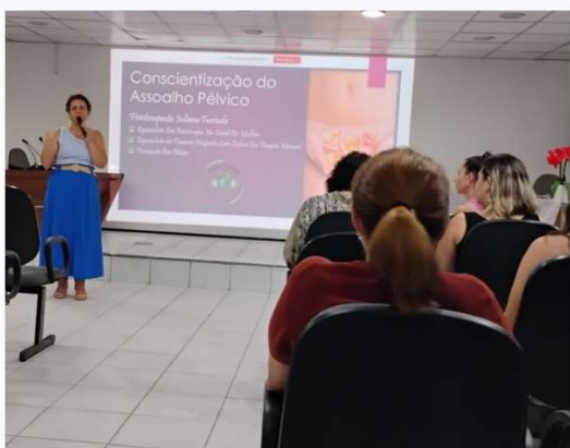
Dia Internacional da Mulher