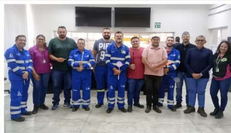
Capacitação dos Operadores de EB