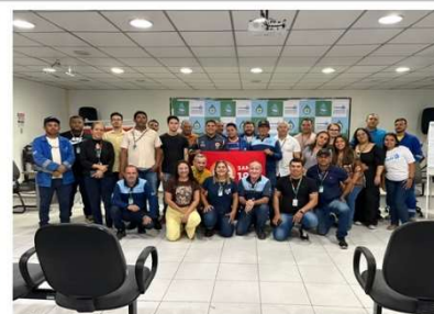
Suporte Básico de Vida