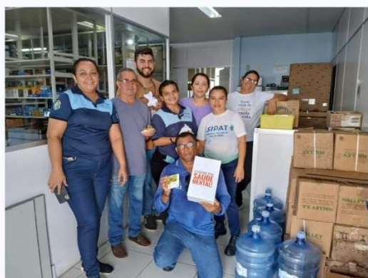
Janeiro Branco - Sede