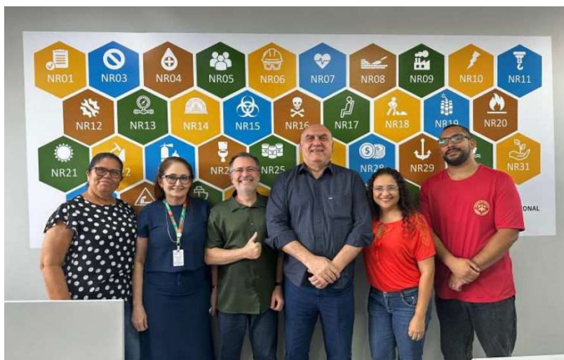
Figura 1: Registro Fotográfico da inauguração da sala do SESMT

Em 2025, nossa maturidade refletiu-se em iniciativas de liderança, como o ‘ Prêmio Destaque em SST ’, implantado no ‘ Café com Supervisores ’, que capilarizará a responsabilidade pela segurança desde as gerências regionais até a ponta da operação.