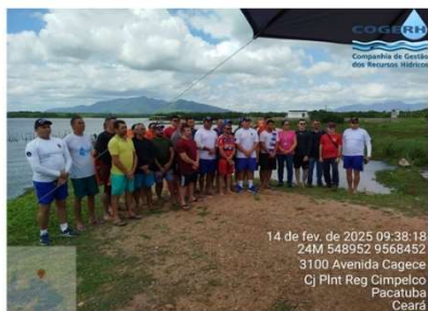
Pilotagem de Barcos (Timoneiros)