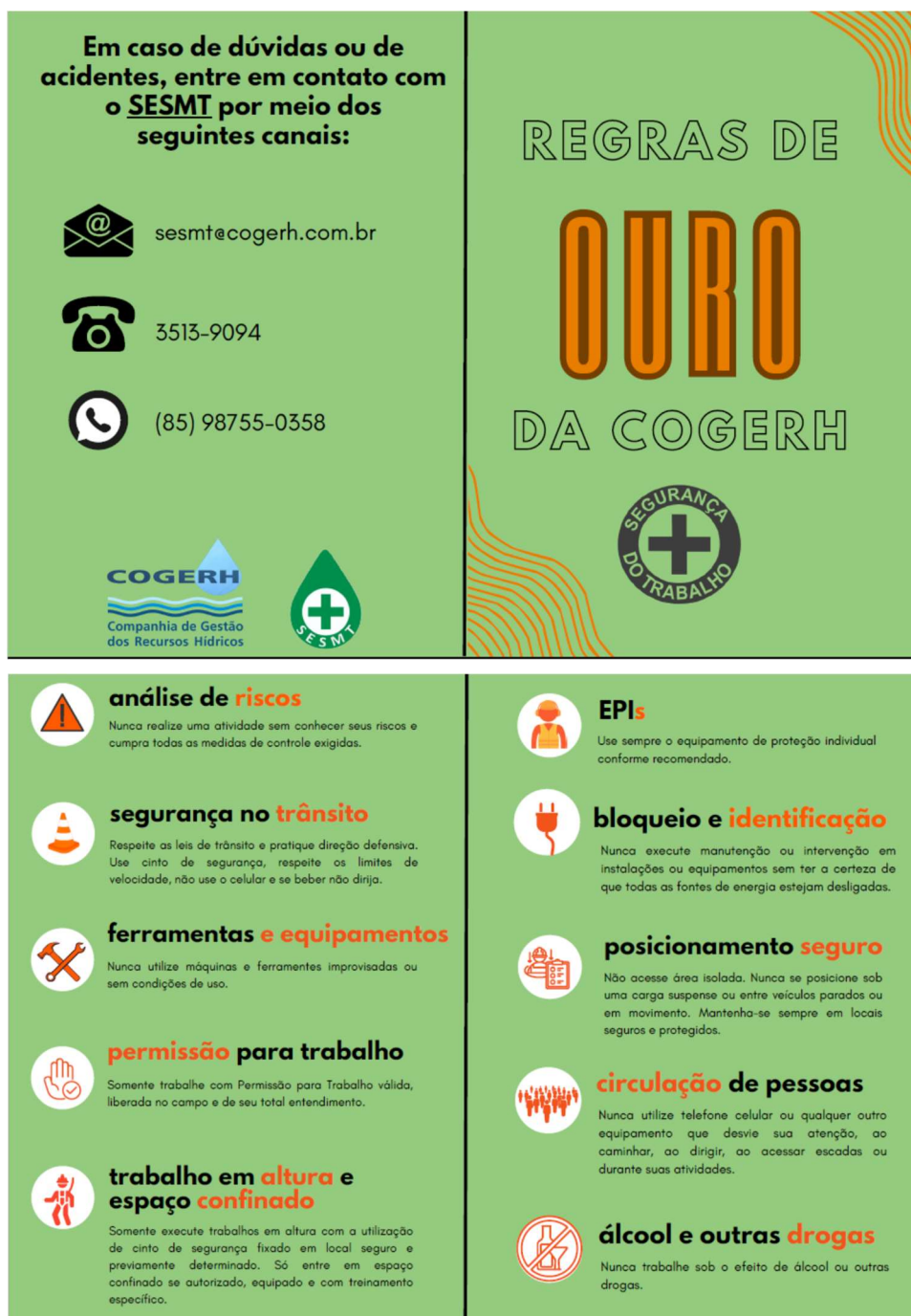
Figura 9: Panfleto de Divulgação