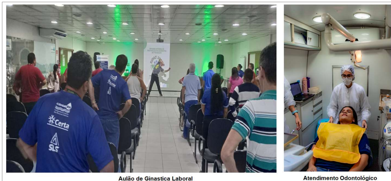
Figura 5: Registro Fotográfico das Ações de Saúde na SIPAT

Durante a Semana Interna de Prevenção de Acidentes de Trabalho (Sipat) também foram incluídas ações de saúde ocupacional, como: campanha de vacinação, aferição de Pressão Arterial e verificação de glicemia, orientações sobre hipertensão e diabetes, exposição sobre a Dengue seguida de blitz nos setores, aula de ginástica laboral e atendimento odontológico.