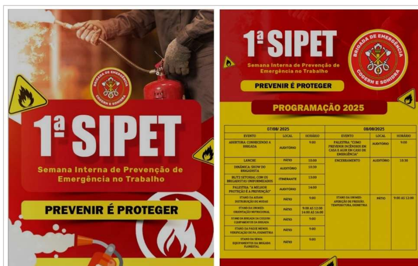
Figura 3: Registro Fotográfico da SIPET