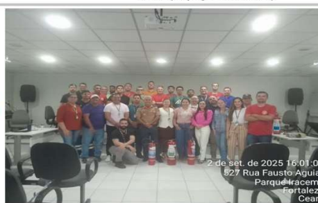
Formação da Brigada