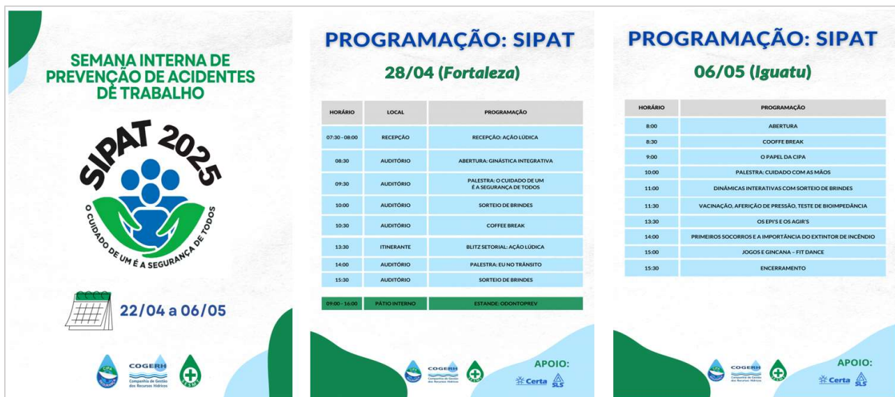
Figura 1: Registro Fotográfico da SIPAT