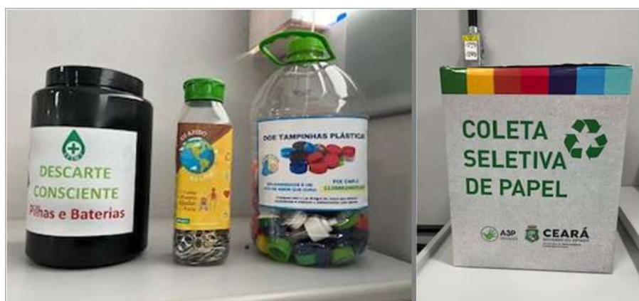
Figura 8: Registro Fotográfico das Ações de Sustentabilidade

As ações de sustentabilidade, integradas à saúde, como a coleta de papéis, lacres de alumínio, tampinhas plásticas e pilhas, reforçaram o compromisso da Cogerh com a Agenda Ambiental na Administração Pública (A3P) . Tais iniciativas socioambientais não apenas preservam o meio ambiente, mas promovem o engajamento solidário dos colaboradores, destinando recursos para instituições filantrópicas, como a Associação de Catadores e Catadoras Raio de Sol, o Lar Amigos de Jesus e o Programa “Eu Ajudo na Lata” da Unimed Fortaleza, fortalecendo o sentimento de pertencimento e propósito na equipe.