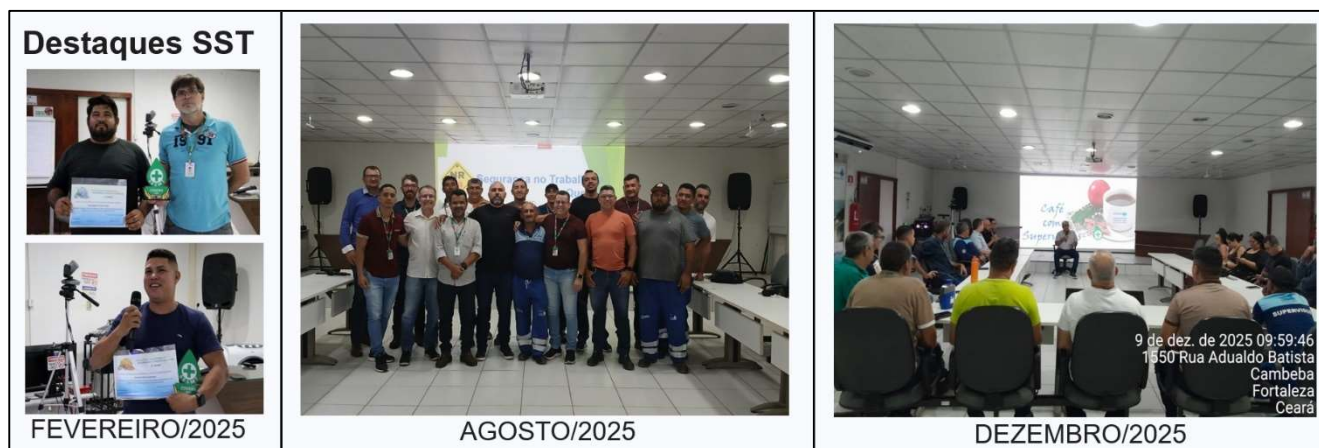
Figura 2: Registro Fotográfico – Café com Supervisores