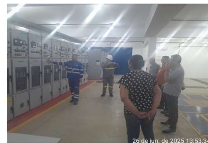
NR 10 - Serviços com Eletricidade