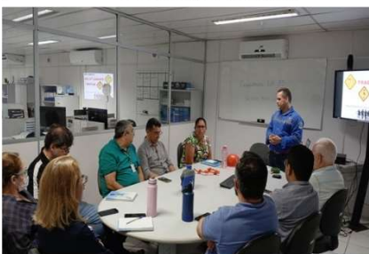
NR 35 - Trabalho em Altura