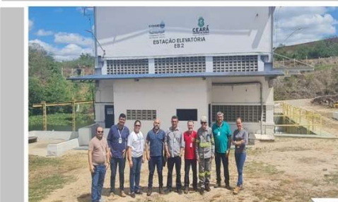
SEP (Sistema Elétrico de Potência)